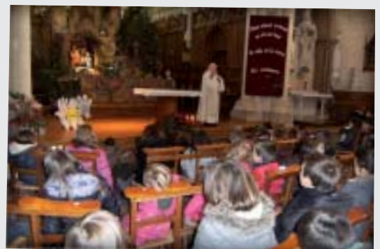
Les enfants de l'école de la Remaudière ont célébré Noël lundi 16 décembre.