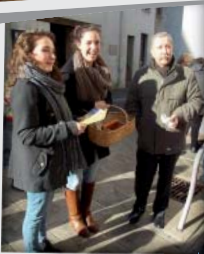
Les jeunes vendent des articles de Noël au profit du Secours catholique à la fin de la messe du 8 décembre au Loroux.