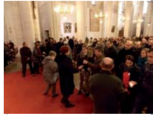
L'échange des bougies, signe de la continuité entre les générations ...

Les prêtres et diacres qui seront les "témoins privilégiés du mariage" rencontrent également les fiancés pour les aider à préciser leur projet et mettre en œuvre la célébration. Le jour du mariage, fleuristes, marguilliers, animateurs, organistes permettent de faire de ce jour "le beau jour"!