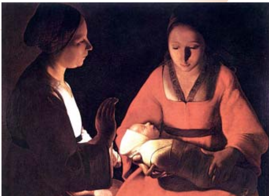
Trois œuvres de Georges de la Tour sont réunies au Passage Sainte-Croix (Nantes) jusqu'au 8 février.

Le chrétien discerne, au milieu des incendies éphémères qui s'allument autour de lui, les feux fragiles mais non moins séduisants qui s'allument dans la prière, la méditation de la Parole ou dans l'amour fraternel. Ils annoncent et expriment déjà la Grande Lumière de