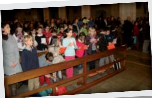
Accueil des enfants qui se préparent au sacrement de première communion lors de la messe du 14 décembre à Saint Julien.