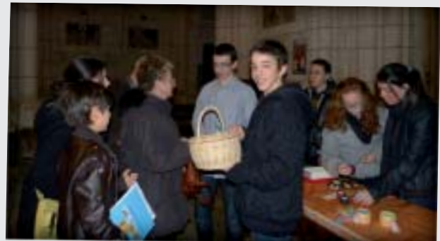
Les jeunes qui se préparent au sacrement de confirmation vendent des bougies au profit du Secours catholique à la fin de la messe du 7 décembre à Saint Julien.