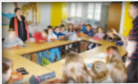
Temps fort de préparation à la première des communions le 17 janvier 2015.