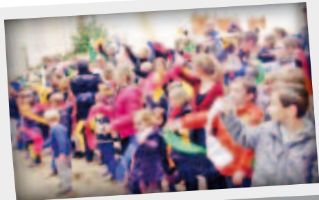
Messe de Noël à la Chapelle Basse Mer le 24 décembre 2014.