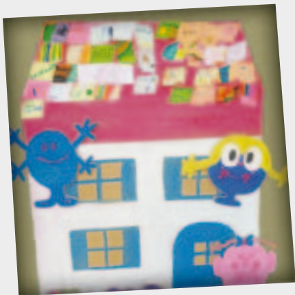
La maison des 5 sens - Temps fort d'éveil à la foi le 17 janvier 2015.