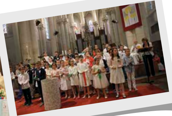
Messes de première des communions pour 78 enfants les 10 et 17 mai 2015 à l'église du Loroux