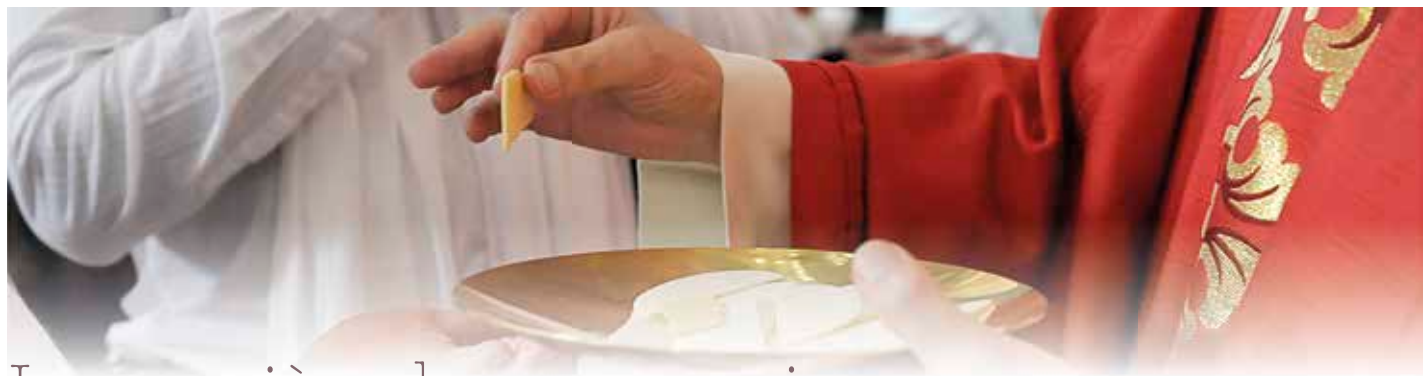
Clic / Corinne Meier