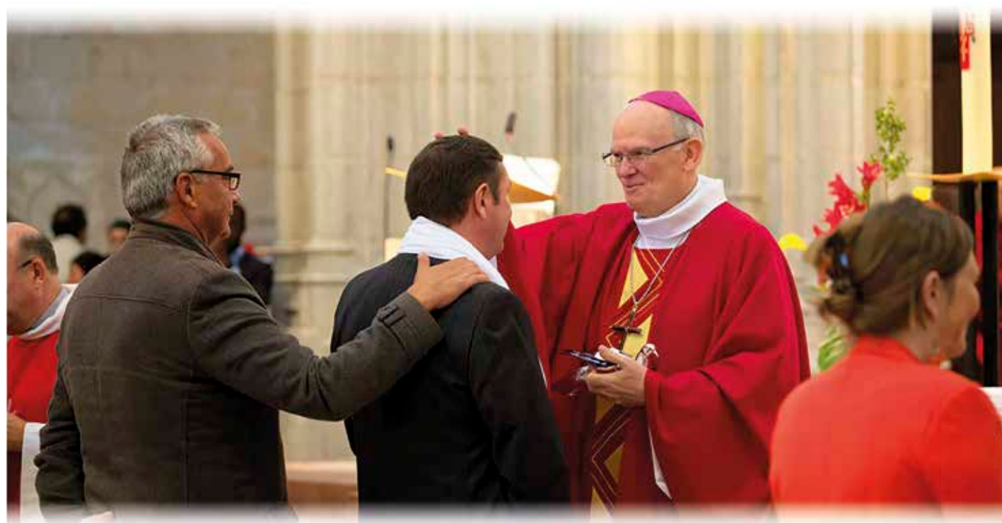
Confirmation de près de 200 adultes à la cathédrale de Nantes le 24 mai 2015