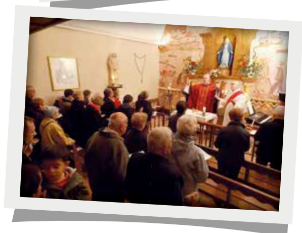
Messe de la Saint Simon le mercredi 28 octobre 2015 à la chapelle Saint Simon à la Chapelle Basse Mer.