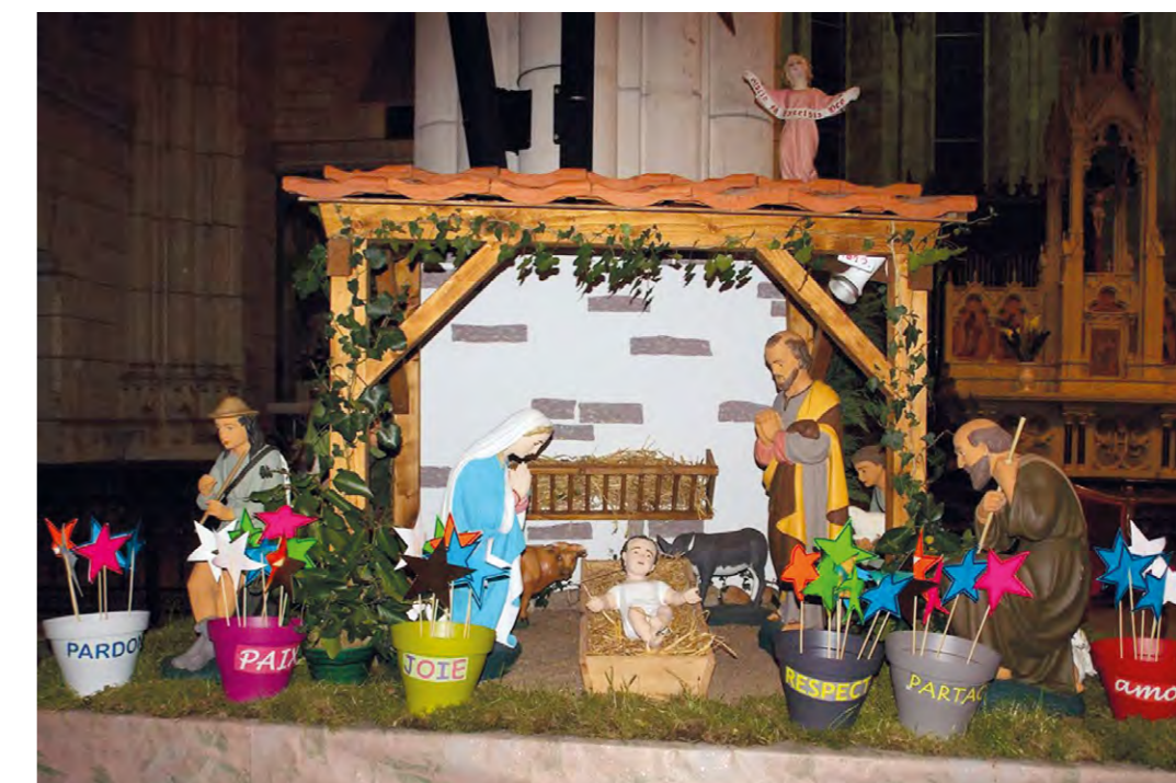
Messe de Noël à Saint-Julien le jeudi 24 décembre 2015.