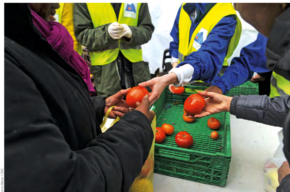
Chaque dimanche, les bénévoles de l'association "La tente des glaneurs" redistribuent des fruits et légumes invendus récupérés auprès des commerçants en fin de marché. Marché Joinville. Paris (75), France.

"J'ai un grand désir que le peuple chrétien réfléchisse durant le Jubilé sur les œuvres de miséricorde corporelles et spirituelles." (pape François) Les œuvres de miséricorde sont les actions charitables par lesquelles nous venons en aide à notre prochain dans ses besoins corporels et spirituels. Les œuvres de miséricorde "spirituelles" nous ont été transmises par une tradition qui trouve son origine dans les écrits des Pères de l'Église et qui devient probablement définitive au cours du XII e siècle : "conseiller