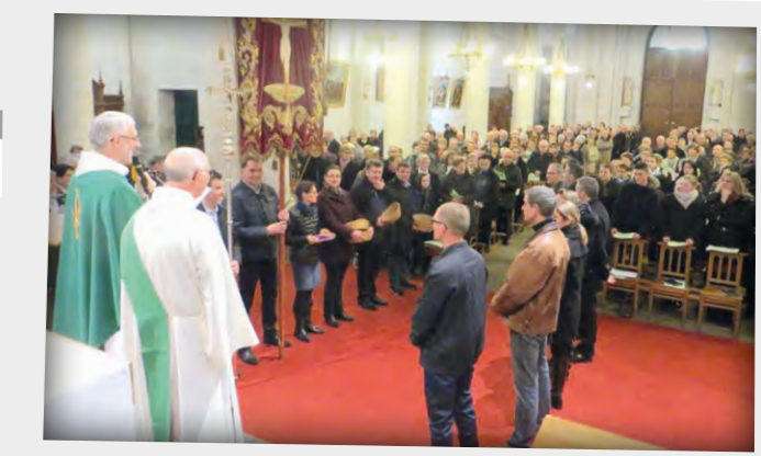
Présentation des nouveaux marguilliers à la Chapelle Basse-Mer le 17 janvier 2016.