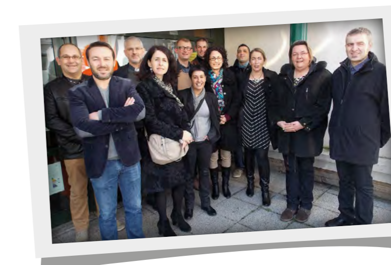
Présentation des nouveaux marguilliers au Loroux le dimanche 24 janvier 2016.