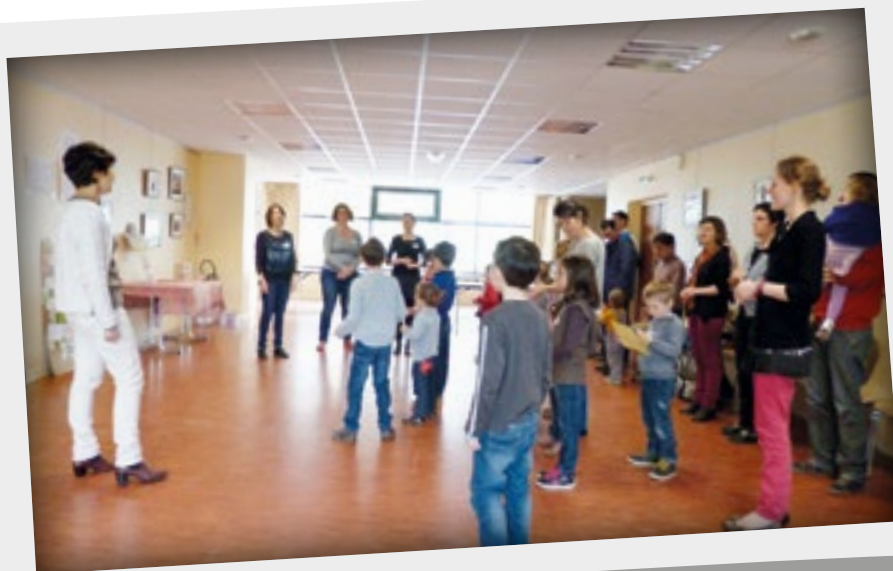
Temps fort d'éveil à la foi du dimanche 24 avril 2016.