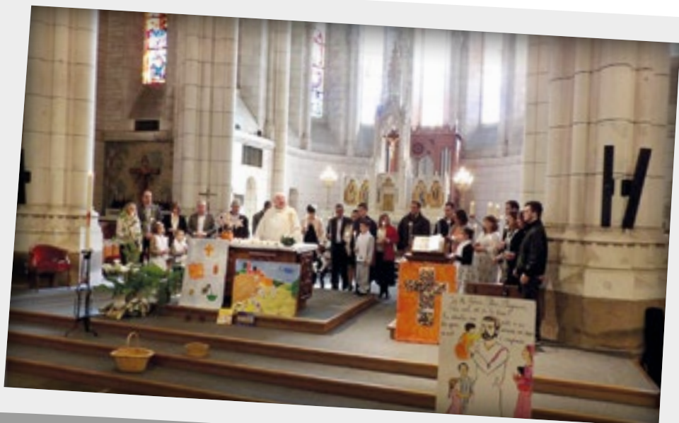
Baptême des enfants entre 3 et 7 ans le 3 avril 2016 à Saint Julien.