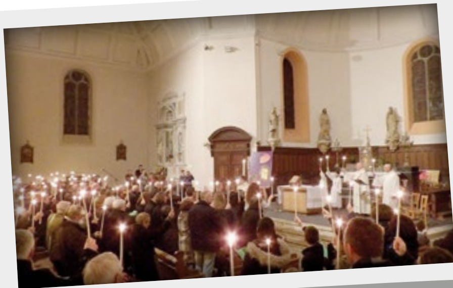
Veillée pascale au Landreau le samedi 26 mars 2016.