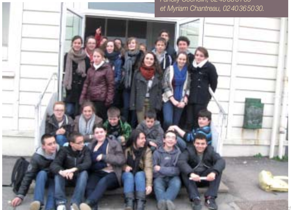
Les jeunes de 4 e /3 e aux portes du collège Notre-Dame.

Pâques fait penser au Seigneur, aux prières, à la Pâque des Juifs, à la trahison de Judas, à la messe, au reniement de Pierre, aux cloches, à la cène, aux vacances, à Saint-Thomas, aux repas de famille, aux amis, au chocolat, et au bonheur!