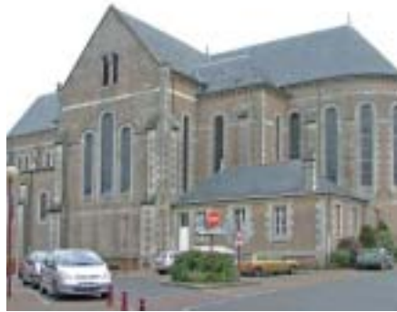
Église de Saint-Julien