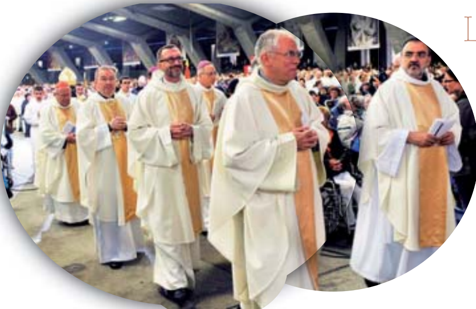
12000 délégués de tous les diocèses de France.

L'objectif premier de 'Diaconia' est d'appeler nos communautés à vivre davantage, dans la réciprocité, la fraternité et l'espérance avec les personnes en situation de fragilité, proches ou lointaines. Après deux années de démarche 'Diaconia' dans tous les diocèses de France, 250 délégués nantais se sont retrouvés à Lourdes du 9 au 11 mai. 17 personnes représentaient la Zone Vignoble dont 4 de notre paroisse. ■