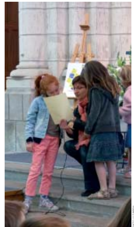
Le 2 juin, lors de l'éveil à la foi à la Chapelle Basse-Mer.

Mon rôle est d'aider les parents à faire découvrir Jésus à leurs jeunes enfants.