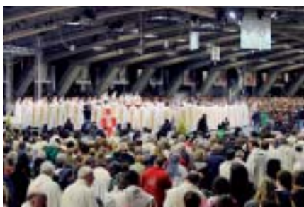
Grand rassemblement national Diaconia à Lourdes.