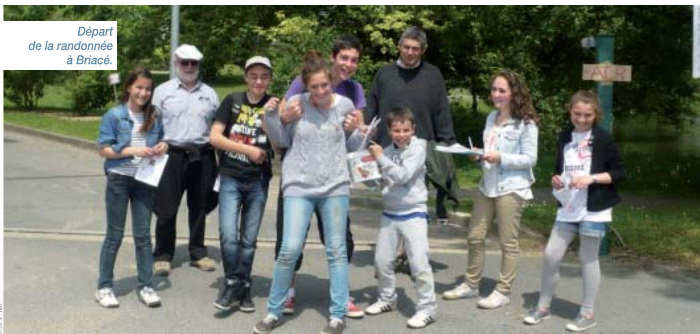
Départ de la randonnée à Briacé.