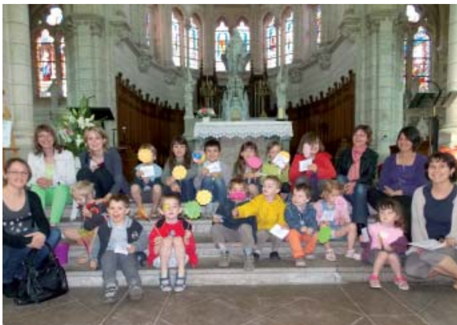
Les enfants réunis à la fin de la messe dans l'église de la Chapelle Basse-Mer.