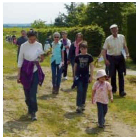
Rando à travers les vignes du Landreau.